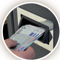
Devolución de billetes en fajos