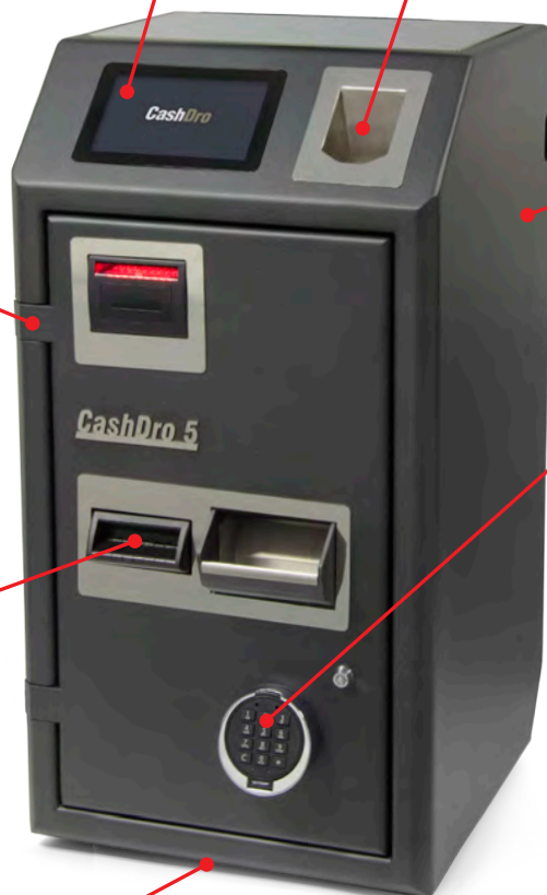
Cierre de seguridad electrónico con apertura retardada (opcional)