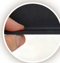
Chapa de acero de 4 mm