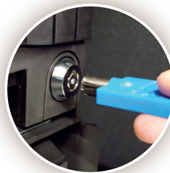
Bloqueos interiores de acceso al efectivo (opcionales)